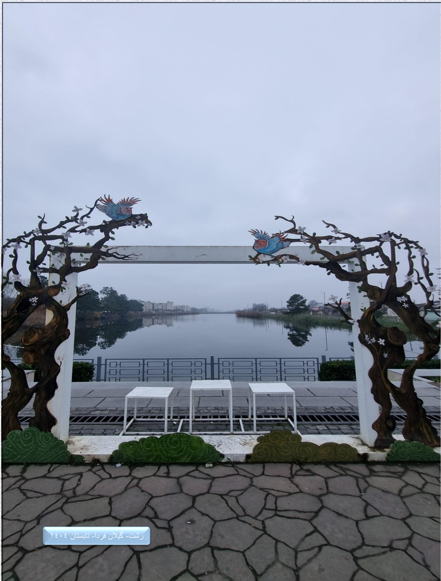
رشت- گیلان فردا- تابستان ۱۴۰۴